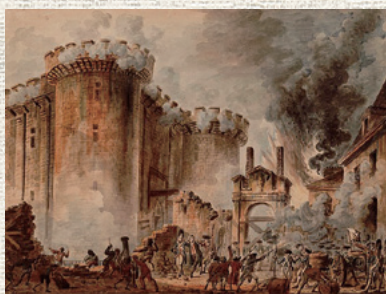
▲バスチーユ襲撃(ウエール)

フランス革命と同時期のアメリカでは、関税自主権を巡り、ボストン港で輸入された積荷の紅茶を海に投げ捨てる事件が起こりました。これがアメリカの独立戦争に、そして英蘭戦争に繋がったのは有名な話ですが、この話には続きがあります。アメリカは政治的理由に起因してお茶が飲めなくなったタイミンゲで、コーヒーを薄めて毎日飲む方法(アメリカン)を自国で編み出したように見えますが、それが現在まで続く大国の成立に繋がったともいえます。新大陸として恐ろしいほどの早